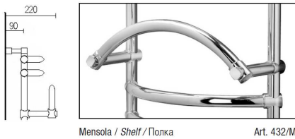
Mensola / Shelf / Полка

Pressione di esercizio massima 6 Bar Maximal working pressure 6 bar Максимальное рабочее давление - 6 бар.