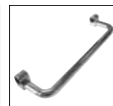
Optionals pag. 174