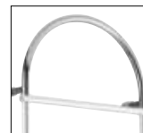
Optionals pag. 170

ACCESSORI DISPONIBILI A RICHIESTA OPTIONALS AVAILABLE ON REQUEST ДОПОЛНИТЕЛЬНЫЕ ОПЦИИ