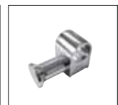
Optionals pag. 173