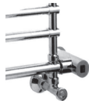
Блок комбинированного электрического подключения