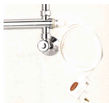
Шнур с кнопкой вкл./выкл. на сетевой вилке