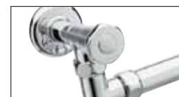
Maniglia a richiesta (vedi pag.186) Handle on request (see page 186) Ручка по запросу (см. стр. 186)

RU Поворотный полотенцесушитель из трубы диаметром Ø25 мм. Дополнительный модуль: Недоступный Комбинированная версия: Недоступный Однотрубная версия: Недоступный Напольное подключение: Недоступный Расстояние от стены: 135/600 мм